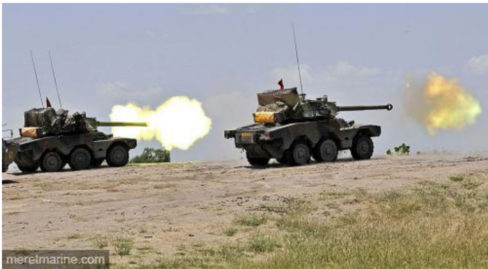
Chars ERC-90 Sagaie