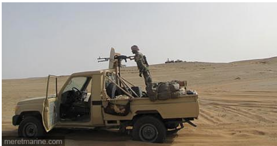
Pick-up des djihadistes au Mali