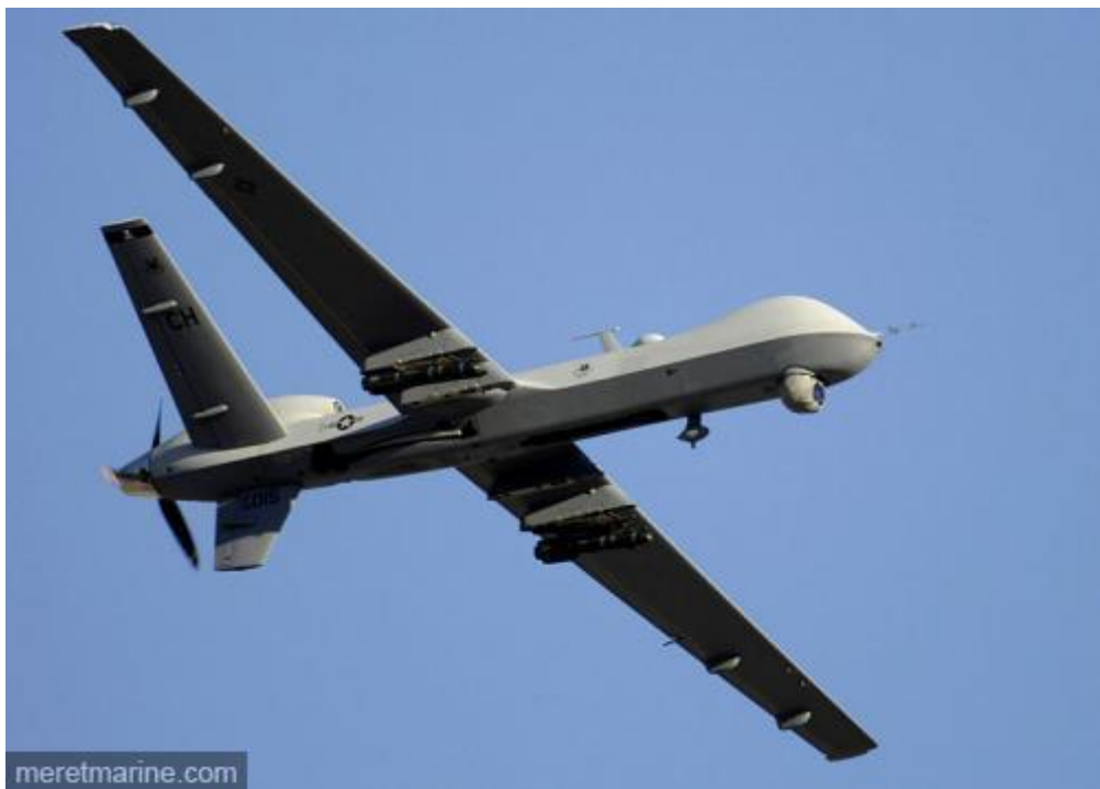
Drone MQ-9 Reaper