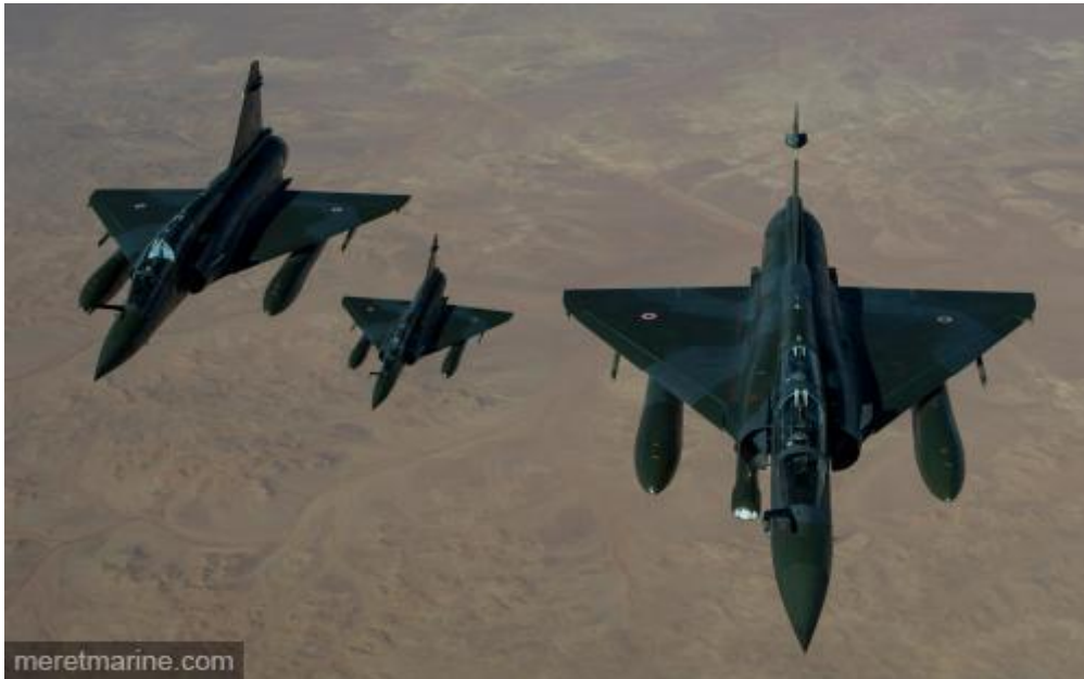
Mirage 2000D basés à N'Djamena

Tôt ce matin, quatre Rafale ont décollé de la base aérienne 113 de Saint Dizier avec pour objectif des camps d'entraînement, des infrastructures et des dépôts logistiques constituant les bases arrière des groupes terroristes. A l'issue de ces frappes, accompagnés par deux C135F, les quatre Rafale ont rejoint la base aérienne de N'Djamena pour renforcer les moyens engagés dans l'opération « Serval ». A Bamako, l'état-major tactique et la compagnie d'infanterie qui appartenaient au groupement terre de l'opération « Epervier » ont été renforcés aujourd'hui par une compagnie d'infanterie en provenance de France où elle était bien placée en alerte. Deux cent militaires du 2 ème régiment d'infanterie de marine ont été projetés avec leur matériel à Bamako, par deux rotations d'avions Airbus A310 et A340 de l'escadron de transport « Esterel ».