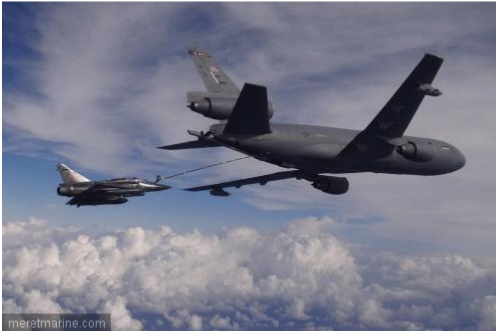
Mirage 2000 auprès d'un ravitailleur américain, ici en 2011