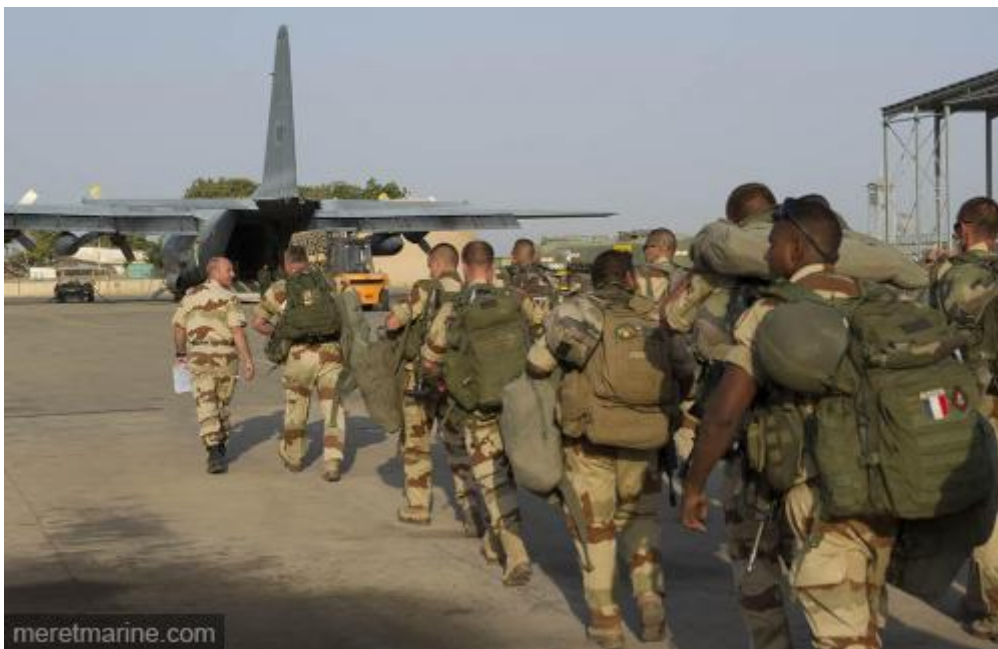
Projection de troupes depuis N'Djamena

Tôt ce matin, quatre Rafale ont décollé de la base aérienne 113 de Saint Dizier avec pour objectif des camps d'entraînement, des infrastructures et des dépôts logistiques constituant les bases arrière des groupes terroristes. A l'issue de ces frappes, accompagnés par deux C135F, les quatre Rafale ont rejoint la base aérienne de N'Djamena pour renforcer les moyens engagés dans l'opération « Serval ». A Bamako, l'état-major tactique et la compagnie d'infanterie qui appartenaient au groupement terre de l'opération « Epervier » ont été renforcés aujourd'hui par une compagnie d'infanterie en provenance de France où elle était bien placée en alerte. Deux cent militaires du 2 ème régiment d'infanterie de marine ont été projetés avec leur matériel à Bamako, par deux rotations d'avions Airbus A310 et A340 de l'escadron de transport « Esterel ».