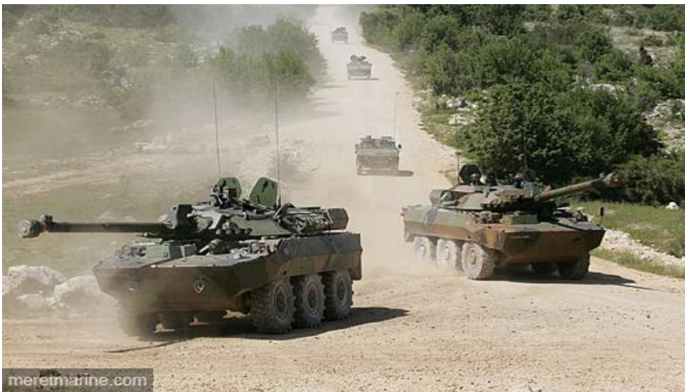
Chars AMX-10 RC