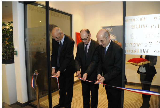
Coupure du ruban : (1)